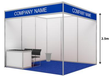
Gian hàng 2 mặt mở